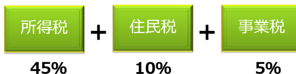
【表 所得税の税率表】

不動産賃貸業であっても、5棟 10室以上を賃貸していると事業的規模となれば、事業税 5%が課されます。